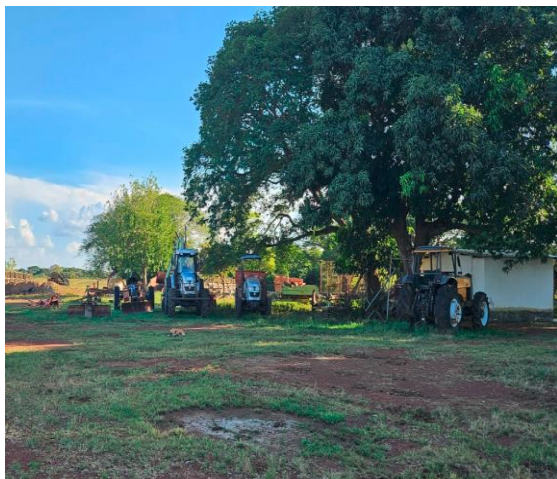
Maquinaria – la Romana