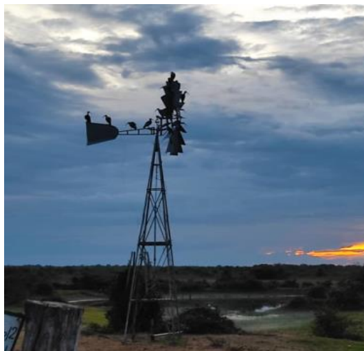
Molino fundación el tigre