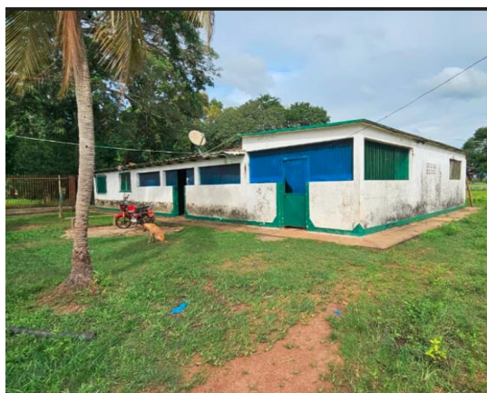
Casa principal – La Romana