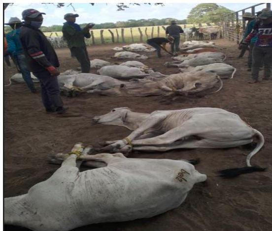
Herrado de mautes