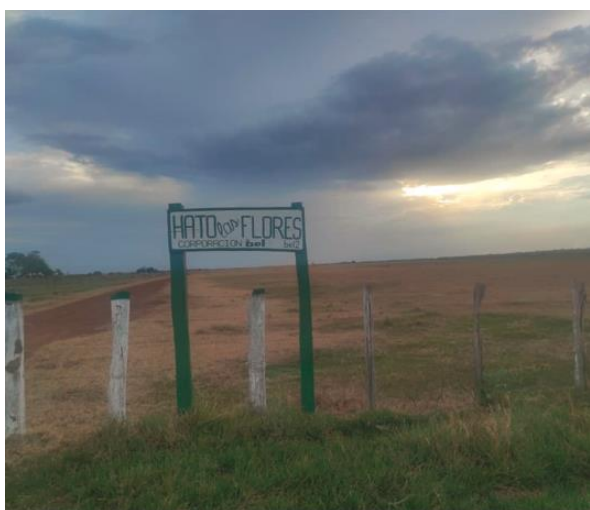
Entrada de hato Las flores