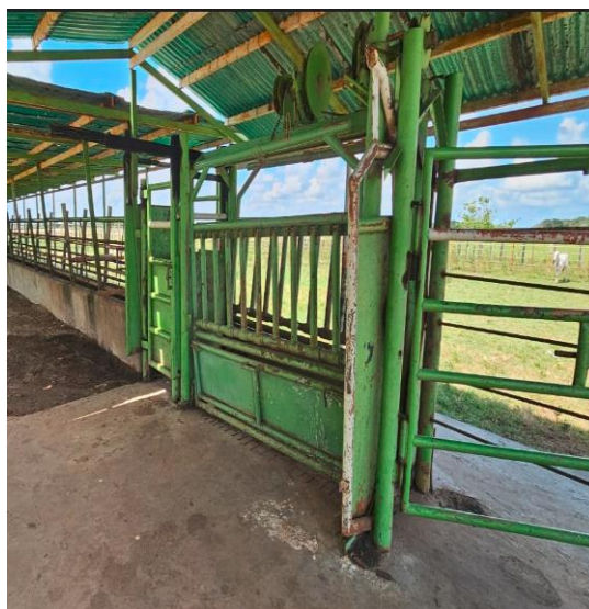
Brete de trabajo