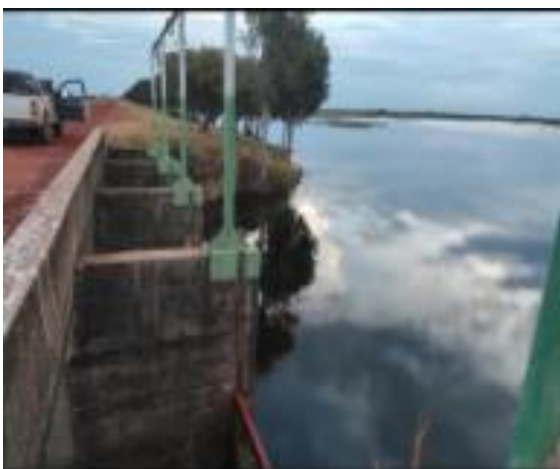
Estructuras de represa