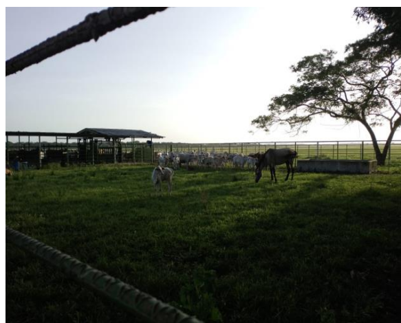
Corrales el tigre I