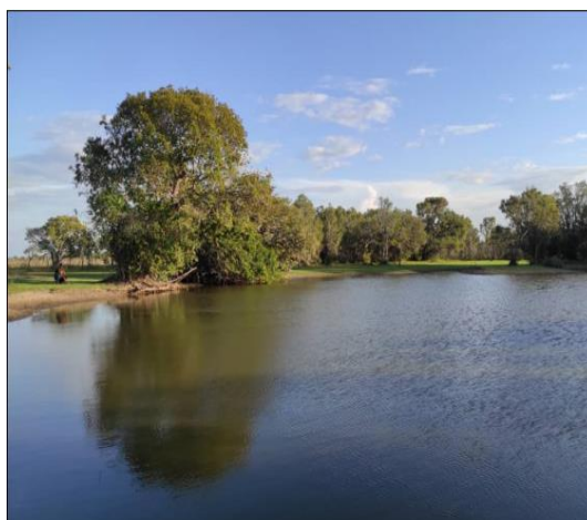
Laguna del saladillal