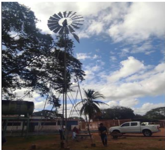
Molino de la romana