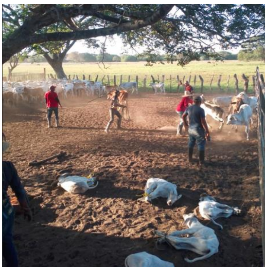
Trabajo de llano