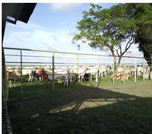
Corrales tigre II