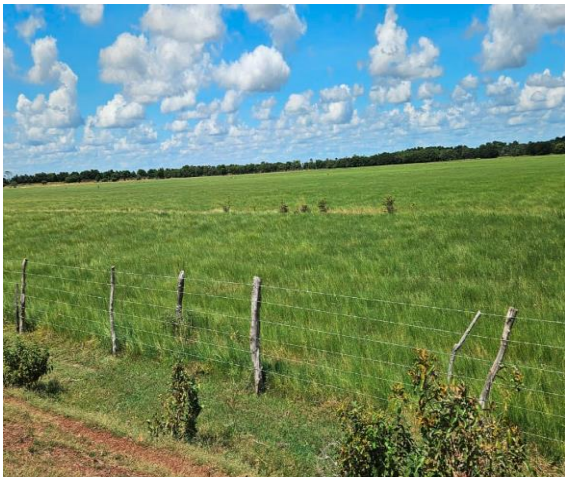
Semillero fundación el Tigre