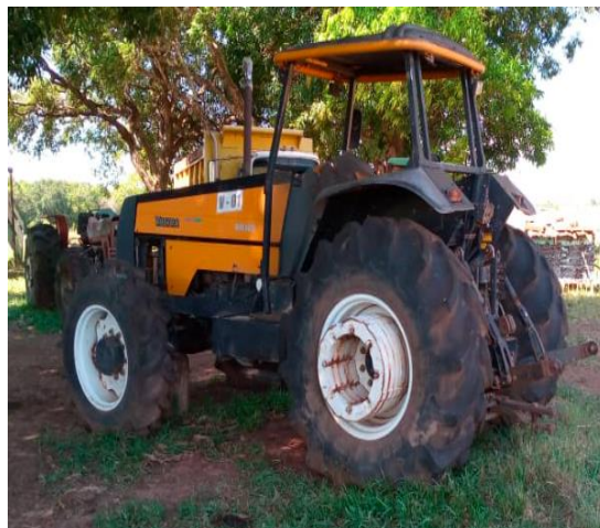
Tractor Valtra 180