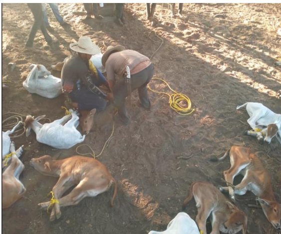
Tatuado de becerros