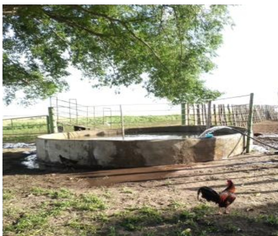
Instalaciones de Guaratarito