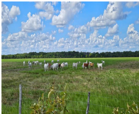
Potrero fundación el tigre I