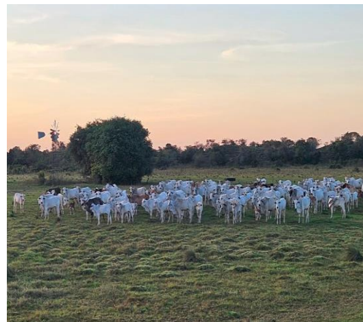
Lote de mautes