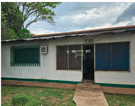
Casa principal – Pissa