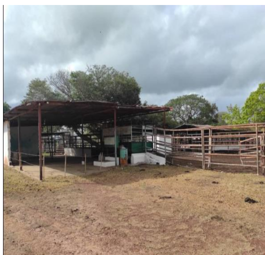
Corrales de fundación La Romana