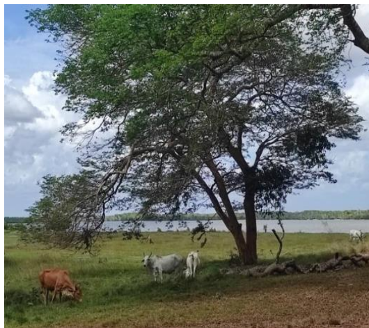
Potrero Mata larga