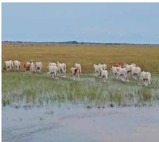
Animales en la sabana