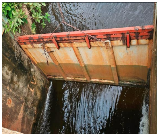
Compuerta de la represa