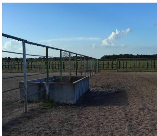
Corrales Mata larga