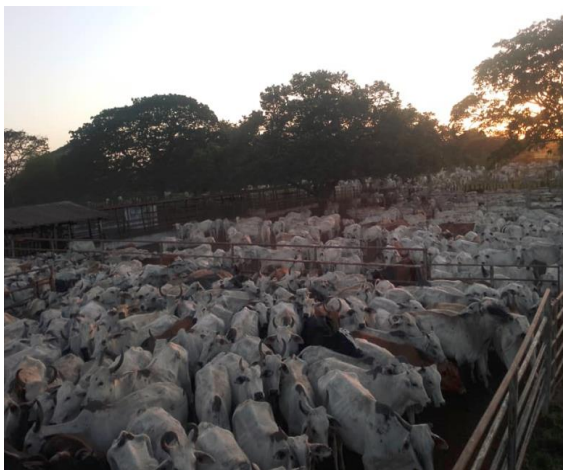
Lote de vacas de cría