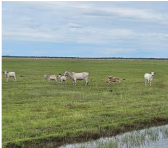
Animales en potrero