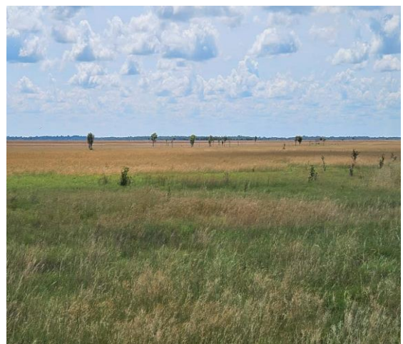
Sabana de hato las Flores